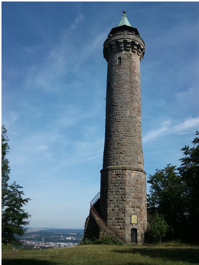
Der Humberturm auf dem Humberg bei Kaiserslautern (2013)

Fachsicht(en): Kulturlandschaftspflege, Denkmalpflege, Landeskunde, Architekturgeschichte