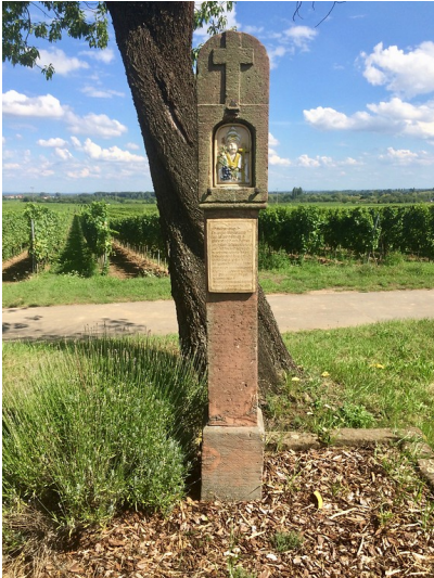
Bildstock im mittleren Weinspeer in Maikammer (2017)

Fachsicht(en): Kulturlandschaftspflege, Landeskunde, Denkmalpflege