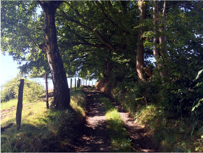
Naturdenkmal Hohlweg in Odenthal-Busch (2016)