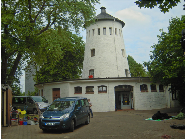
Friemersheimer Mühle in Duisburg-Rheinhausen (2016).

Fachsicht(en): Kulturlandschaftspflege, Landeskunde