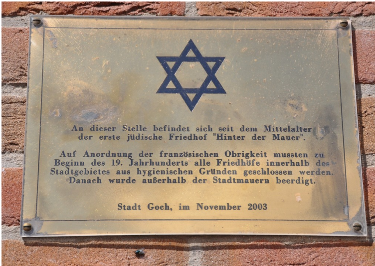
Gedenk- und Erinnerungstafel erinnert an den alten jüdischen Friedhof "Hinter der Mauer" in Goch (2016).

Fachsicht(en): Kulturlandschaftspflege , Landeskunde