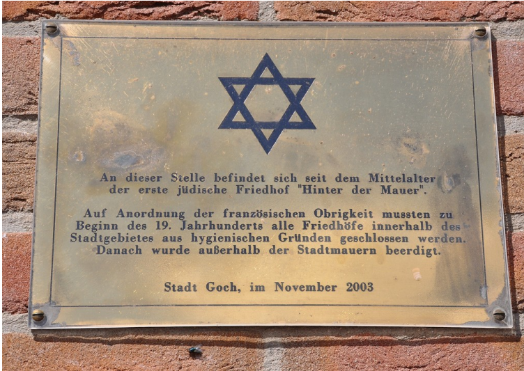
Gedenk- und Erinnerungstafel erinnert an den alten jüdischen Friedhof "Hinter der Mauer" in Goch (2016).

Fachsicht(en): Kulturlandschaftspflege, Landeskunde