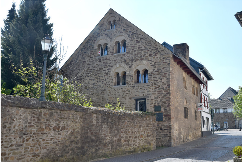
Das Romanische Haus in Bad Münstereifel, Ansicht von der Straße Langenhecke (2017)