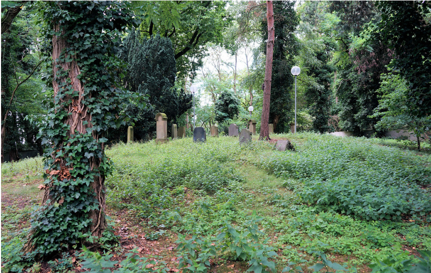
Gräberfeld im Innenbereich des Jüdischen Friedhofs in Dormagen-Zons (2017).

Fachsicht(en): Kulturlandschaftspflege, Landeskunde