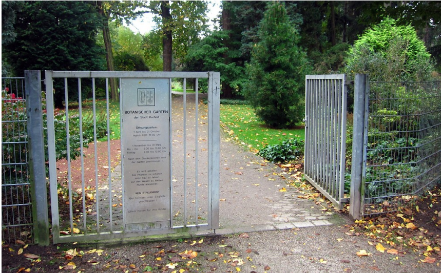
Zugang zum Botanischen Garten im Schönwasserpark in Krefeld (2014).