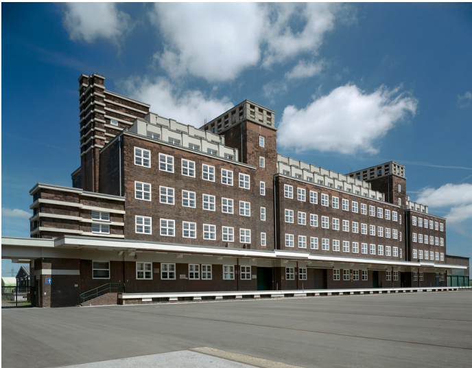
Der Peter-Behrens-Bau, ehemaliges Hauptlagerhaus der Gutehoffnungshütte, heute Zentraldepot der LVR-Industriemuseen in Oberhausen (2009).

Fachsicht(en): Kulturlandschaftspflege, Architekturgeschichte