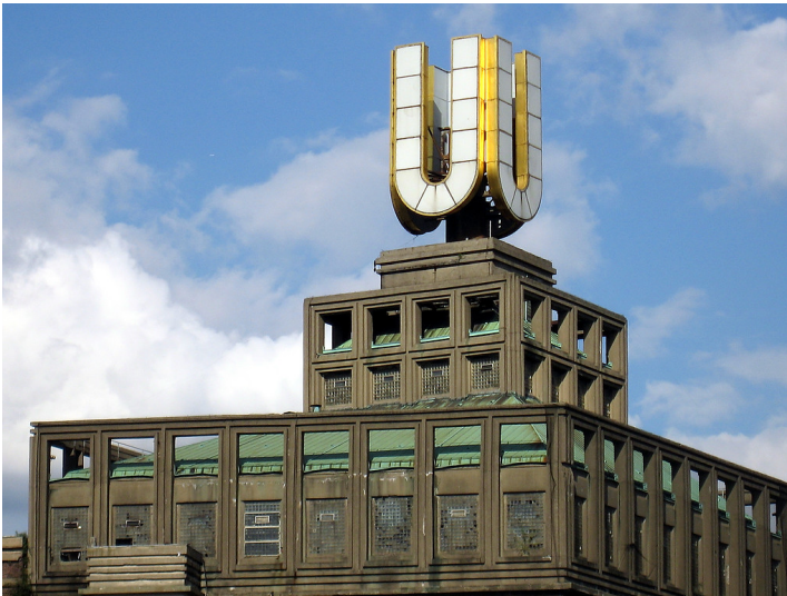
Oberer Teil der Westfassade des Hochhauses I der Union Brauerei in Dortmund (Brau und Brunnen AG), gekrönt von dem "Dortmunder U" (2007).

Fachsicht(en): Kulturlandschaftspflege, Architekturgeschichte