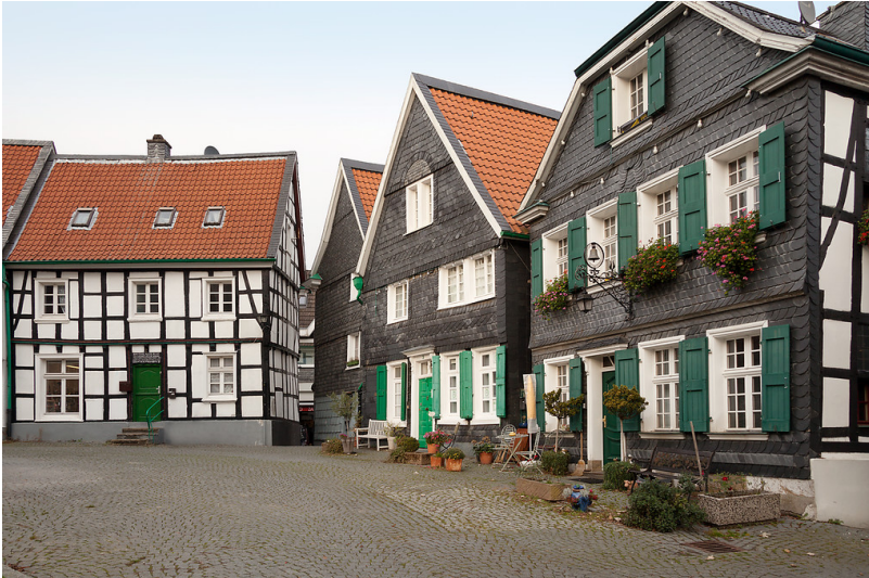
Wülfrath, Kirchplatz 2-4

Fachsicht(en): Archäologie, Denkmalpflege