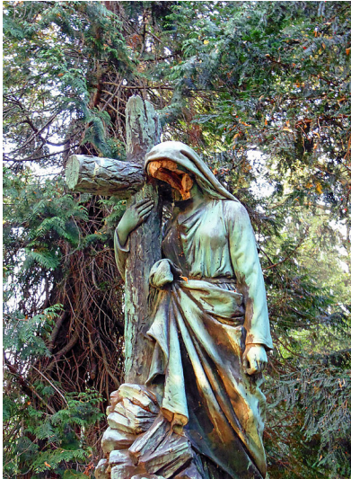
Das fehlende Gesicht einer Grabstatue auf dem ehemaligen Friedhof Deckstein in Köln-Lindenthal verleiht ihr eine morbide und gleichzeitig faszinierende Ausstrahlung (2020).

Fachsicht(en): Kulturlandschaftspflege , Landeskunde