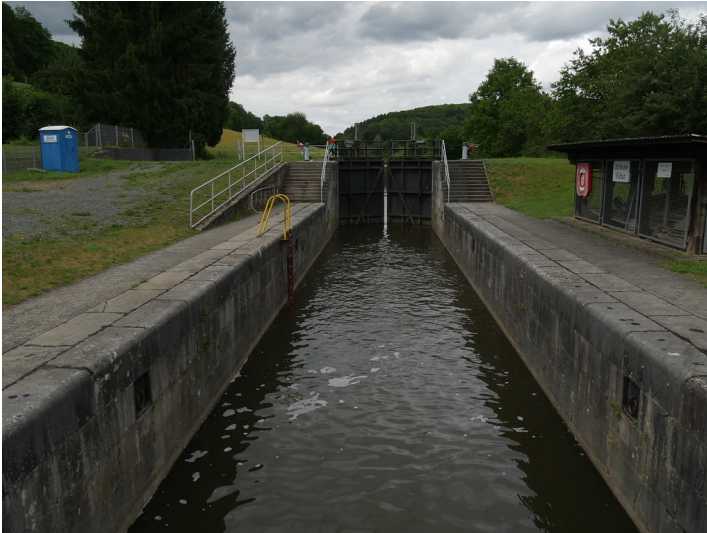
Kammer der Schleuse Fürtfurt bei Villmar (2017)

Fachsicht(en): Kulturlandschaftspflege, Landeskunde