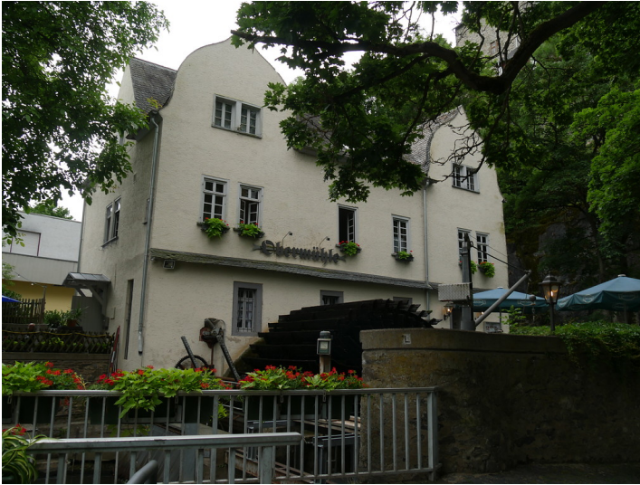
Obermühle Limburg mit Mühlrad (2017)

Fachsicht(en): Kulturlandschaftspflege, Landeskunde