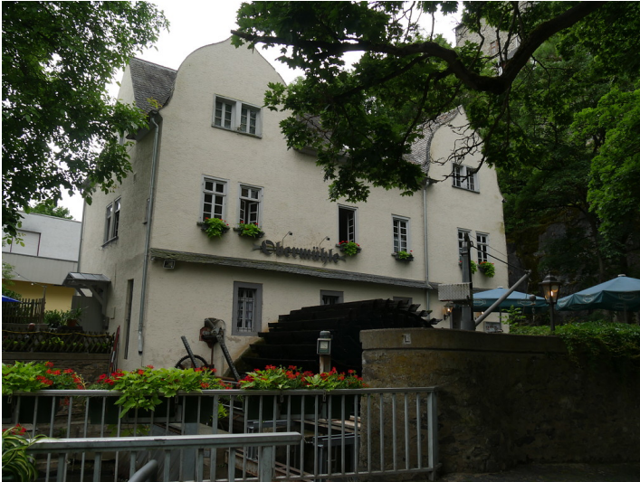
Obermühle Limburg mit Mühlrad (2017)

Fachsicht(en): Kulturlandschaftspflege, Landeskunde