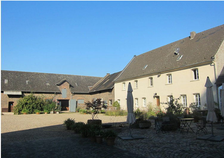
Der Innenhof des Hermeshofes bei Rommerskirchen (2014)

Fachsicht(en): Kulturlandschaftspflege, Landeskunde