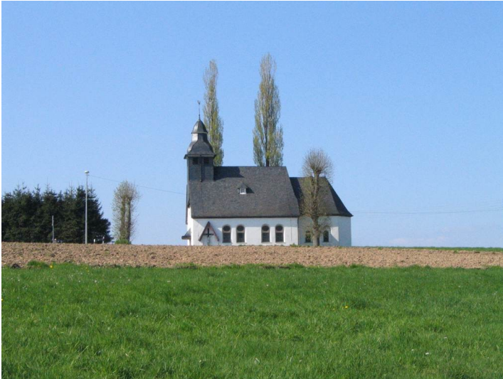
Die Antoniuskapelle "Kapelle St. Antonius Abbas" in Lindlar-Waldbruch (2005)

Fachsicht(en): Kulturlandschaftspflege, Denkmalpflege, Landeskunde