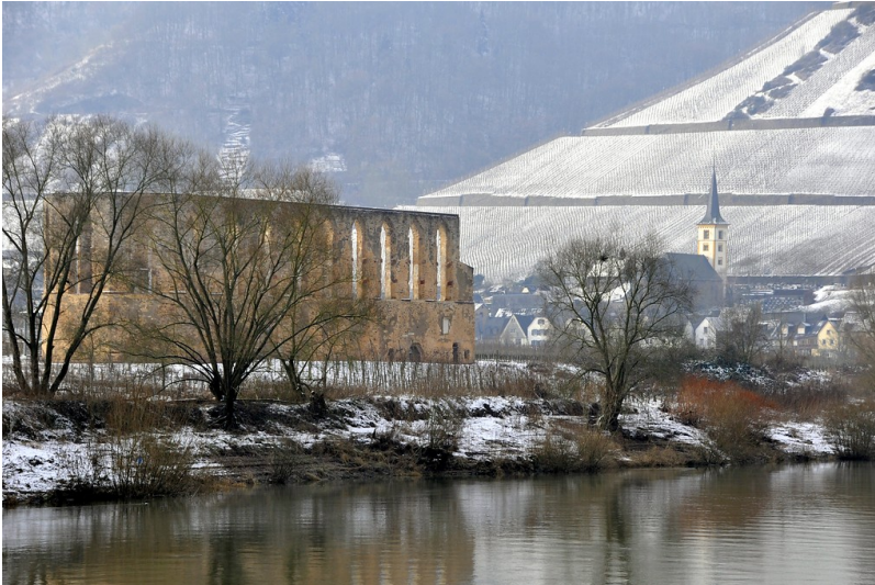
Die Kirchenruine des ehemaligen Augustiner-Chorfrauen-Stifts "Kloster Stuben" (2010), im Hintergrund der Ort Bremm mit der dortigen St.-Laurentius-Kirche.

Fachsicht(en): Kulturlandschaftspflege, Landeskunde