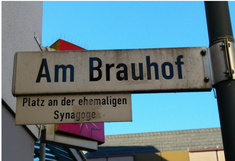
Hinweis auf die ehemalige Synagoge in Siegburg an ihrem früheren Standort am heutigen Platz "Am Brauhof" (2016).

Fachsicht(en): Kulturlandschaftspflege, Landeskunde