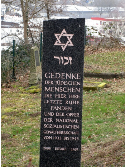
Die Gedenkstele auf dem jüdischen Friedhof Eitorf (2025).

Fachsicht(en): Kulturlandschaftspflege, Landeskunde