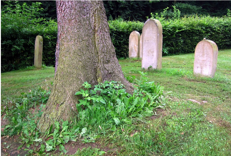
Grabsteine auf dem Judenfriedhof am Buchholzweg in Alfter (2013)

Fachsicht(en): Kulturlandschaftspflege, Landeskunde