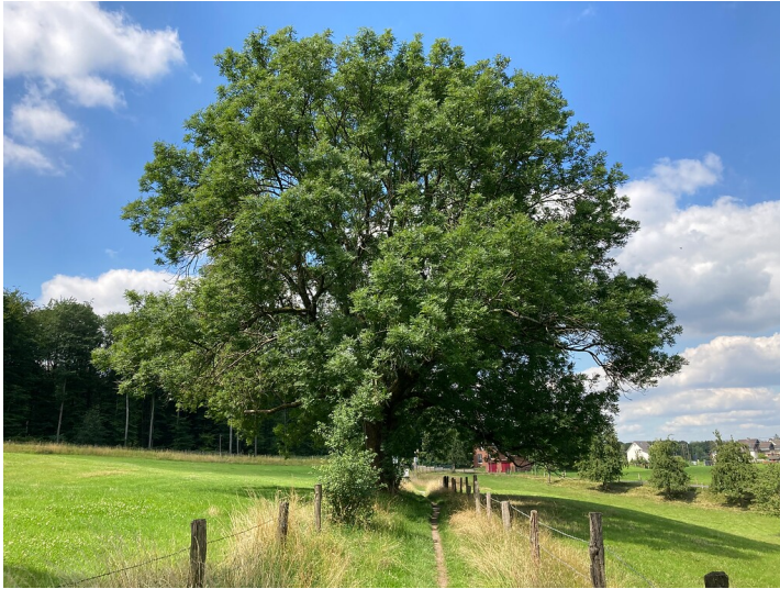
Naturdenkmal Eschen bei Breite (2020)

Fachsicht(en): Kulturlandschaftspflege, Naturschutz