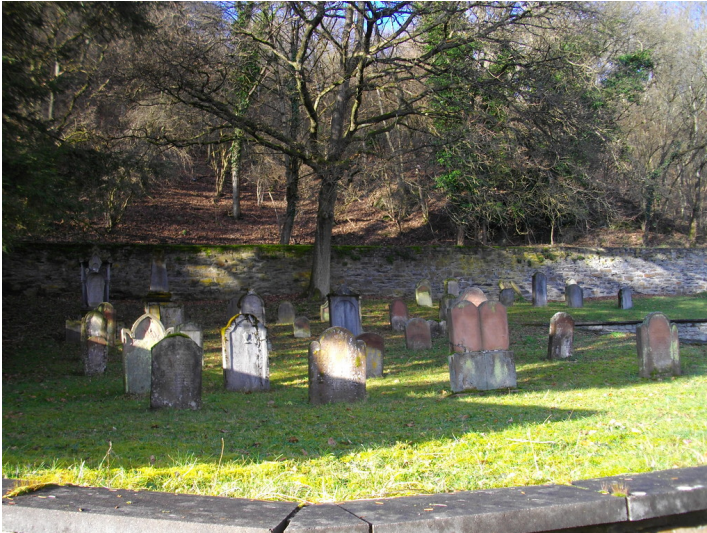
Grabsteine auf dem jüdischen Friedhof in Bad Ems (2008).

Fachsicht(en): Kulturlandschaftspflege, Landeskunde