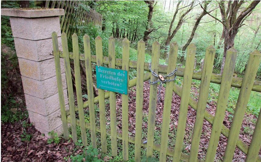
Die verschlossene Eingangspforte am Judenfriedhof Unterm Bingelsberg in Dörrebach, Landkreis Bad Kreuznach (2016).

Fachsicht(en): Kulturlandschaftspflege, Landeskunde