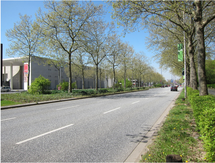
Die Friedrich-Ebert-Allee im Bonner Regierungsviertel auf der Höhe der Kunstmuseen mit Blickrichtung Norden (2015).

Fachsicht(en): Kulturlandschaftspflege, Denkmalpflege