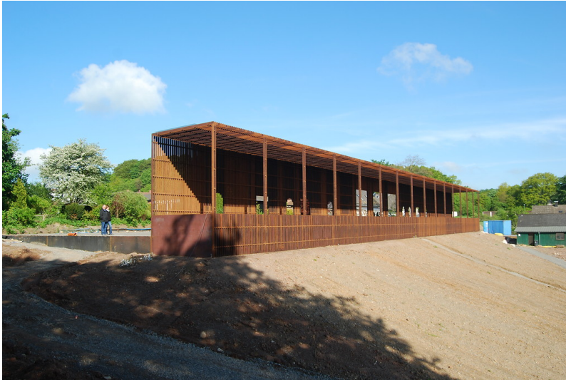
Rekonstruktion der Portikus der Römervilla in Blankenheim (2014)