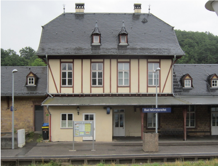
Bahnhof Bad Münstereifel, Empfangsgebäude (2015)