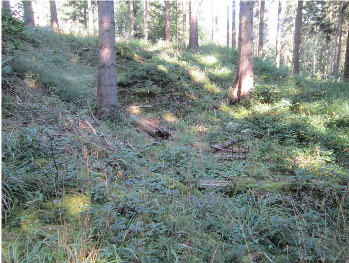
Bergbaugesamt in Kall-Golbach. Blick auf einen Doppelschacht (2016)