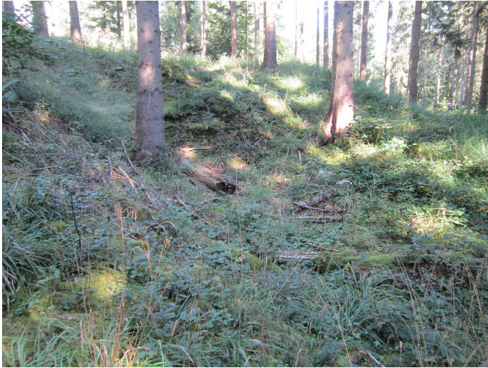
Bergbaugesamt in Kall-Golbach. Blick auf einen Doppelschacht (2016)