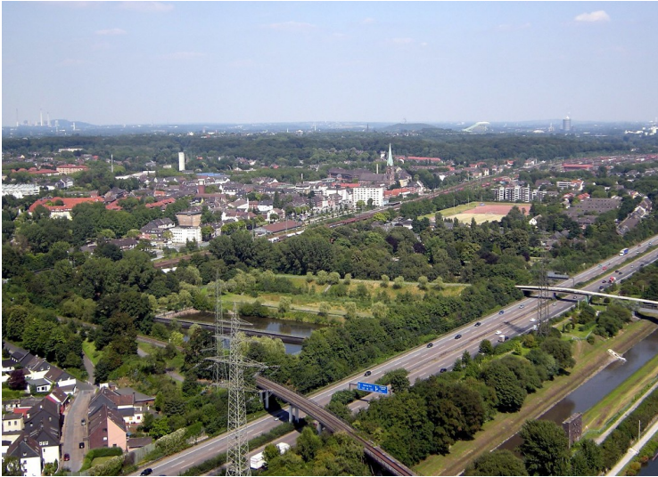
Blick vom Gasometer Oberhausen in Richtung Nordosten nach Osterfeld / Sterkrade (2009)

Fachsicht(en): Kulturlandschaftspflege, Landeskunde