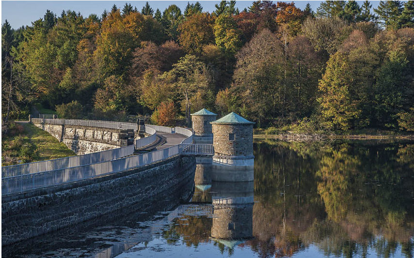
Staumauer der Neyetalstausee bei Wipperführt (2019)

Fachsicht(en): Kulturlandschaftspflege, Architekturgeschichte