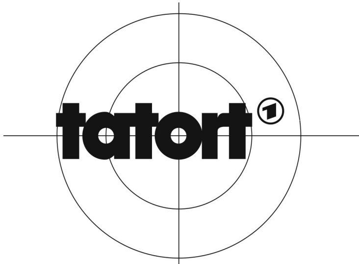
Das Logo der seit 1970 von den deutschen Fernsehsendern der ARD, dem österreichischen ORF und dem schweizer SRF gesendeten Fernseh-Kriminalfilm-Reihe Tatort (2009).