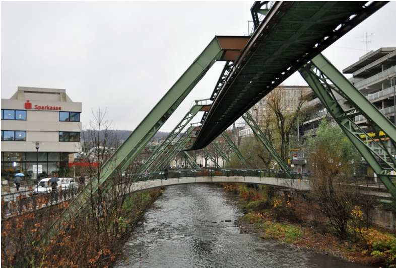
Die Trasse der hier parallel zum Fluss Wupper verlaufenden Wuppertaler Schwebebahn im Bereich der Straße Islandufer (2014).