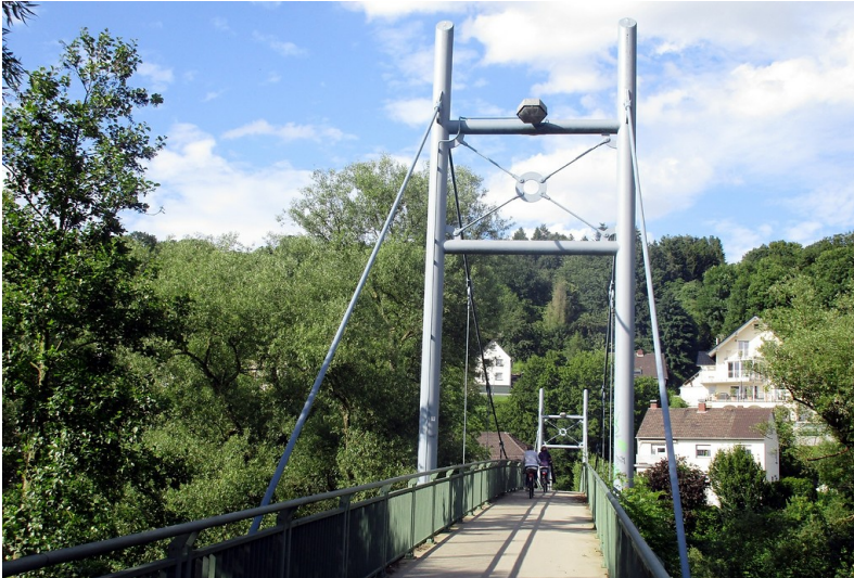
Die Fußgänger- und Fahrradbrücke über die Sieg bei Hennef-Weingartgasse (2016).