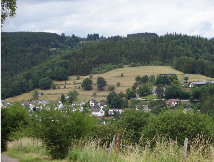
Ackerterrassen bei Hellenthal mit linearen Gehölzformationen parallel zur Hangkante (2015).

Fachsicht(en): Kulturlandschaftspflege, Naturschutz