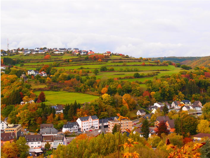
Ackerterrassen oberhalb der Stadt Schleiden an einem sonnigen Herbsttag (2015)

Fachsicht(en): Kulturlandschaftspflege, Naturschutz