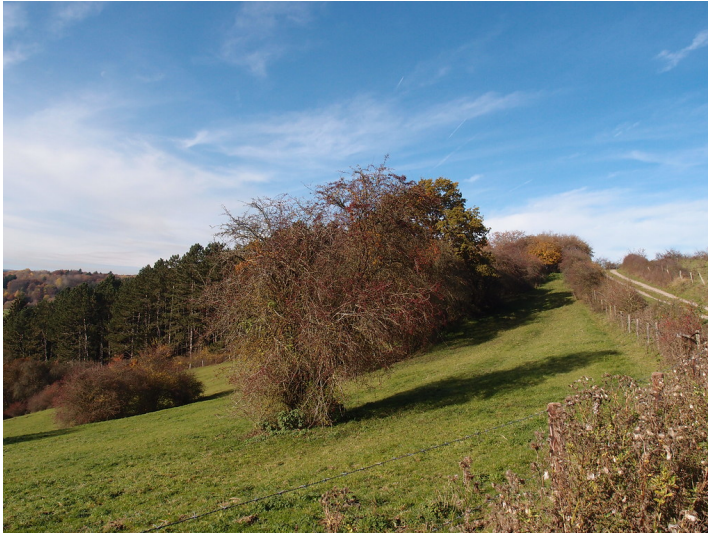
Ackerterrassen bei Blankenheim-Lommersdorf mit linearen Gehölzformationen parallel zur Hangkante (2015).

Fachsicht(en): Kulturlandschaftspflege, Naturschutz