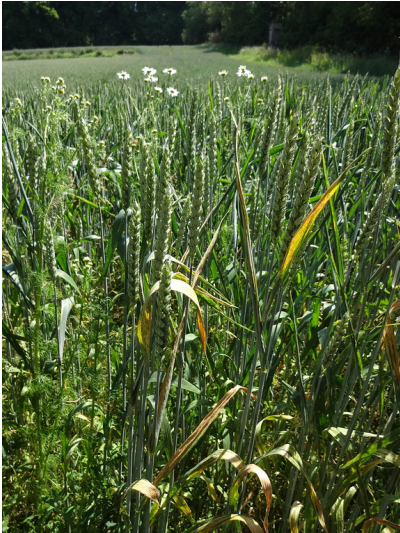
Nahaufnahme eines Getreidefeldes bei Kall-Keldenich (2015)

Fachsicht(en): Kulturlandschaftspflege, Naturschutz