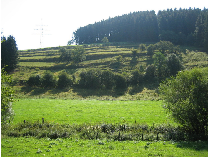
Ackerterrassen bei Dahlem-Berk mit linearen Gehölzformationen parallel zur Hangkante (2015).

Fachsicht(en): Kulturlandschaftspflege, Naturschutz