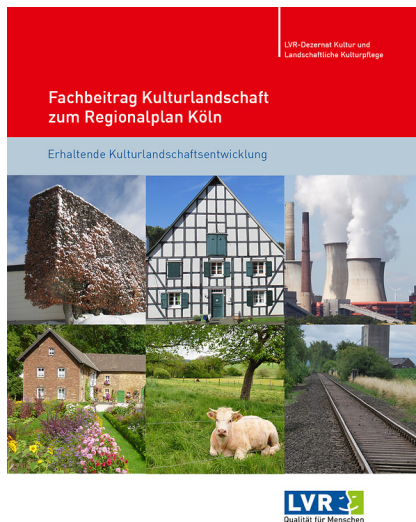
Titel des Fachbeitrags Kulturlandschaft zum Regionalplan Köln (2016)