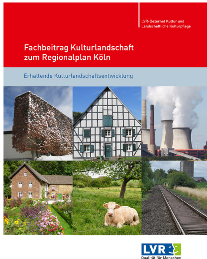
Titel des Fachbeitrags Kulturlandschaft zum Regionalplan Köln (2016)