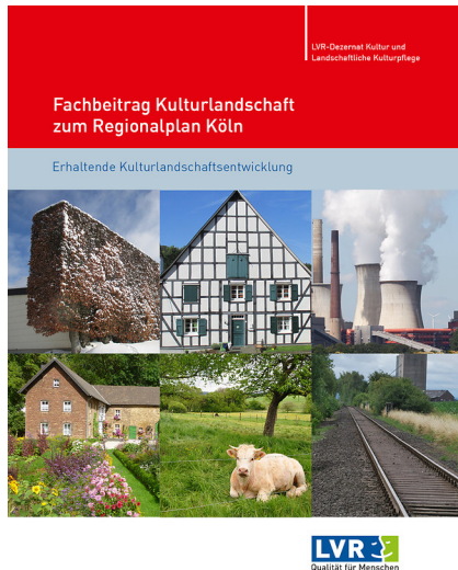
Titel des Fachbeitrags Kulturlandschaft zum Regionalplan Köln (2016)