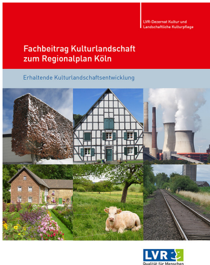
Titel des Fachbeitrags Kulturlandschaft zum Regionalplan Köln (2016)