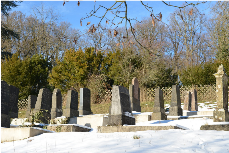
Einzelgräber des jüdischen Friedhofs Am Eichenhang in Seibersbach (2017)

Fachsicht(en): Kulturlandschaftspflege, Landeskunde