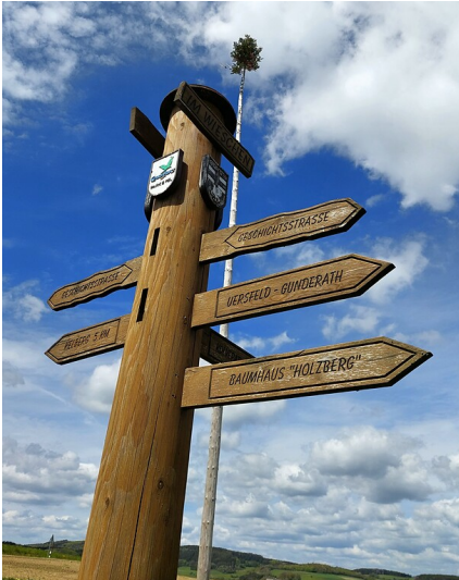
Wegebeschilderung zur Geschichtsstraße bei Kelberg am Aussichtsturm "Eifelguck" bei Sassen, dahinter der örtliche Maibaum (2021).