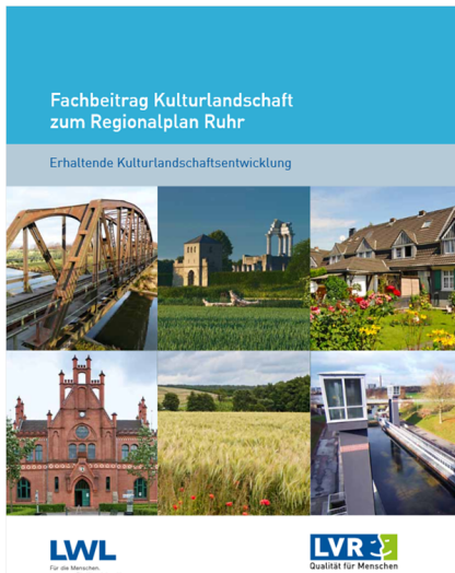
Titel des Fachbeitrags Kulturlandschaft zum Regionalplan Ruhr (2014)