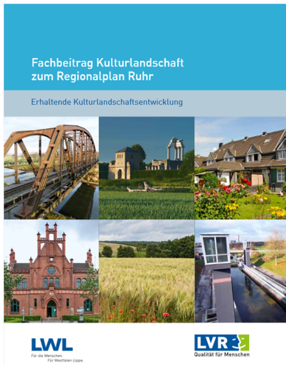
Titel des Fachbeitrags Kulturlandschaft zum Regionalplan Ruhr (2014)