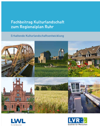
Titel des Fachbeitrags Kulturlandschaft zum Regionalplan Ruhr (2014)