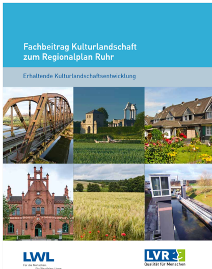
Titel des Fachbeitrags Kulturlandschaft zum Regionalplan Ruhr (2014)