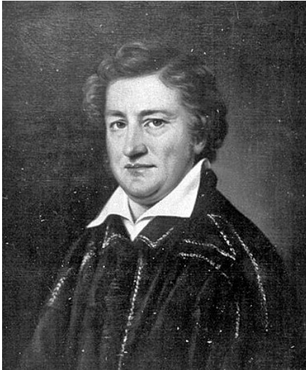
Der Stadtbaumeister und Architekt Johann Claudius von Lassaulx (1781-1848).

Fachsicht(en): Kulturlandschaftspflege, Landeskunde, Architekturgeschichte