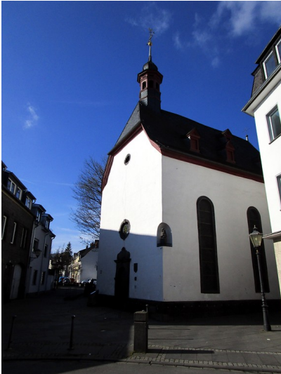
Die Eingangsfront der Heilig-Geist-Kapelle in der Mayener Stehbach (2015).

Fachsicht(en): Kulturlandschaftspflege, Landeskunde