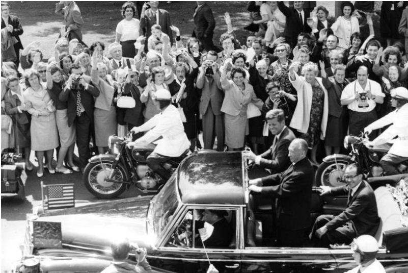
Bundeskanzler Konrad Adenauer und US-Präsident John F. Kennedy während des Staatsbesuchs 1963 bei der Fahrt im offenen Wagen durch ein Spalier jubelnder Zuschauer (23. Juni 1963)

Fachsicht(en): Kulturlandschaftspflege, Landeskunde