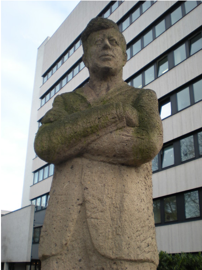
Das John F. Kennedy-Denkmal in Bonn-Plitterdorf in Nahaufnahme (2014)

Fachsicht(en): Kulturlandschaftspflege, Landeskunde