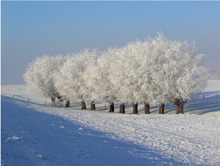
Kopfweiden im Winter bei Kleve-Salmorth (2016).

Fachsicht(en): Kulturlandschaftspflege, Naturschutz