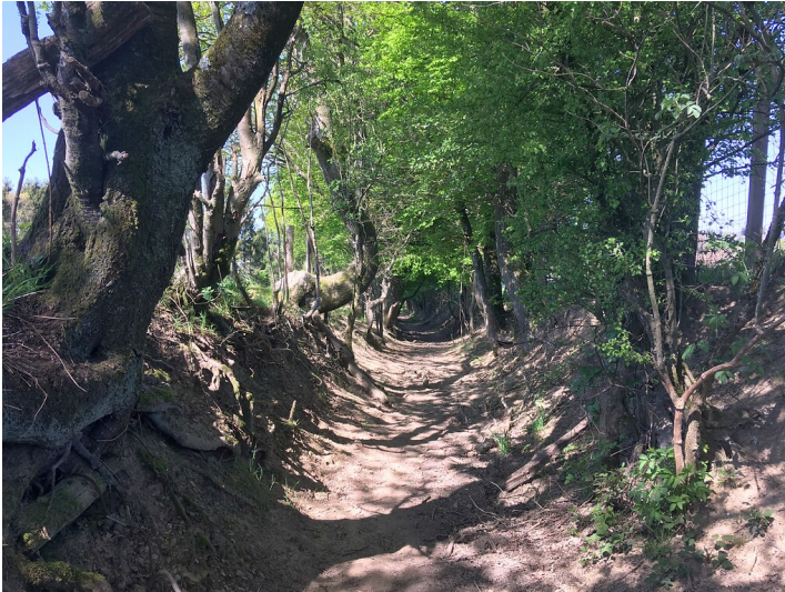
Hohlweg bei Ketzberg (2020)

Fachsicht(en): Landeskunde, Kulturlandschaftspflege